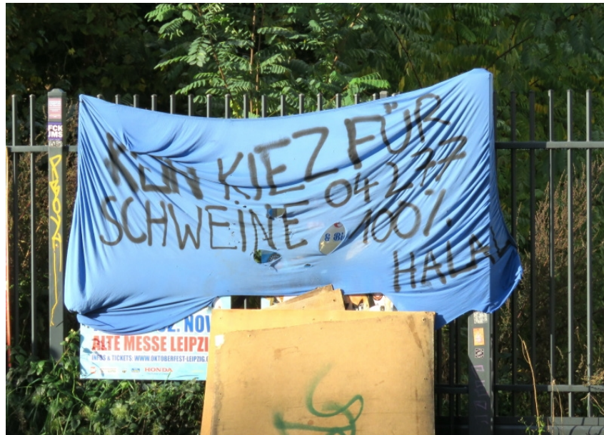
Leipzig Connewitz im November 2019

Allerdings ist hier darauf hinzuweisen, dass die Folgen der Gentrifizierung, steigende Mieten und Immobilienpreise, nicht die Ursache sondern die Symptome der zuvor beschriebenen Entwicklung sind. Wobei es allerdings in realen komplexen System keinen Anfang und kein Ende einer Wirkungsabfolge gibt. Die entstandene Wohnungsmarktlage wird von Spekulanten, Investoren, Anlegern genutzt, um das vagabundierende Kapital gewinnbringend einzusetzen. Diese Situation wurde aber nicht ihnen selber generiert. Gäbe es diese Wohnungsmarktlage nicht, würden sie sich ein anderes Betätigungsfeld suchen. Sie sind also nicht die Verursacher, sondern die mehr oder weniger skrupellosen Trittbrettfahrer. Allerdings verschärfen sie durch ihr Verhalten billigend die prekäre Lage einiger Wohnungssuchender, der ohnehin benachteiligten Bevölkerungsgruppen und sie beschleunigen die Gentrifizierung. Schwindet das vagabundierende Anlagekapital infolge der Pandemie bzw. der resultierenden Wirtschaftskrise oder kann im Zuge des Wiederaufbaus woanders eine höhere Rendite erwirtschaftet werden, endet die Gentrifizierung nicht, sie normalisiert sich lediglich.