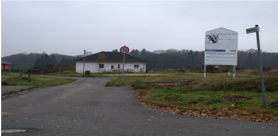
Neubaugebiet Ohfeld im Ortsteil Elm der Stadt Bremervörde im Jahr 2012, sechs Jahre nach Erschließungsbeginn. Kurz darauf wurde die Grundschule im Ortsteil geschlossen. Kürzlich wurden nach fast 14 Jahren die Hälfte der rund 40 Grundstücke überwiegend von Ortsfremden bebaut, die übrigen folgen zeitnah.

Moderiert und angeleitet folgten viele Kommunen den Empfehlungen 6 , stellten ihre Siedlungsentwicklung ein und versuchten ihren Wohnungsbestand aktiv zurück zu bauen. Das Wohnungsbauministerium führte in diesen Jahren u.a. seine große MORO Kampagne 7 und die Bertelsmannstiftung ihre kostenpflichtige Demografieberatung durch 8 . Es entstanden unzählige Handlungskonzepte für schrumpfende Regionen und Städte. Eingeleitet und konditioniert mit sich ständig wiederholenden Impulsreferaten sog. anerkannter Experten und pseudowissenschaftlichen Vorträgen im Stile von Lehramtsproben zu den unausweichlichen Folgen des „demografischen Wandels“ in ihrer Stadt bzw. Gemeinde wurden die wenigen und keineswegs repräsentativen Teilnehmer dieser Workshops moderiert angeleitet, egal wo immer mit den gleichen Ergebnissen. Das war aber nur vorgetäuschte Bürgernähe und ein Missbrauch bürgerlichen Engagements. Beispielsweise und typisch für die Denk- und Vorgehensweise schilderten junge Leute den Experten, Wissenschaftlern und Studenten anschaulich ihre großen Probleme bei der Renovierung der alten Wohngebäude in den engen nordhessischen Ortslagen. Daraufhin wurde u.a. im Werra-Meißner-Kreis kollektiv beschlossen, kein Bauland mehr auszuweisen, damit die jungen Familien nicht dorthin ausweichen können 9 . Viele Gemeinden wurden so erfolgreich in den, wie ich sage, Suizidalmodus des demografischen Wandels hinein